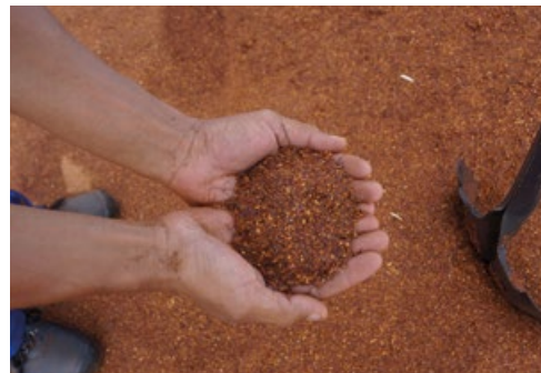
Fermentierter Rooibos.

Um unabhängig zu werden und ihre Lebensverhältnisse nachhaltig zu verbessern, haben die Kleinproduzentinnen und -produzenten die Heiveld-Kooperative gegründet. Ihre Vision: Eine demokratische Organisation, ökologische Landwirtschaft auf eigenen Feldern, Aufbau eigener Strukturen für Verarbeitung und faire Vermarktung.