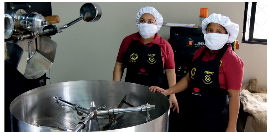
Bei der schonenden Langzeitröstung wird die Trommel von außen erhitzt und die Bohnen werden unter ständiger Bewegung 15 bis 20 Minuten geröstet.

Und in einem zweiten Video berichtet Cruz Dolores Espinoza von den Anfängen und Herausforderungen des Projekts unter https://ogy.de/Espinoza .