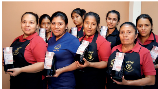
Das Team von APROLMA.

Korruption und allgegenwärtige Gewalt prägen die politische Situation in Honduras und beeinflussen die tägliche Arbeit der Frauenkooperative. Die Frauen im Land sind häufig von Problemen wie häuslicher Gewalt betroffen. APROLMA vertritt die Interessen von Frauen und bietet ihnen neben Schulungen im Bio-